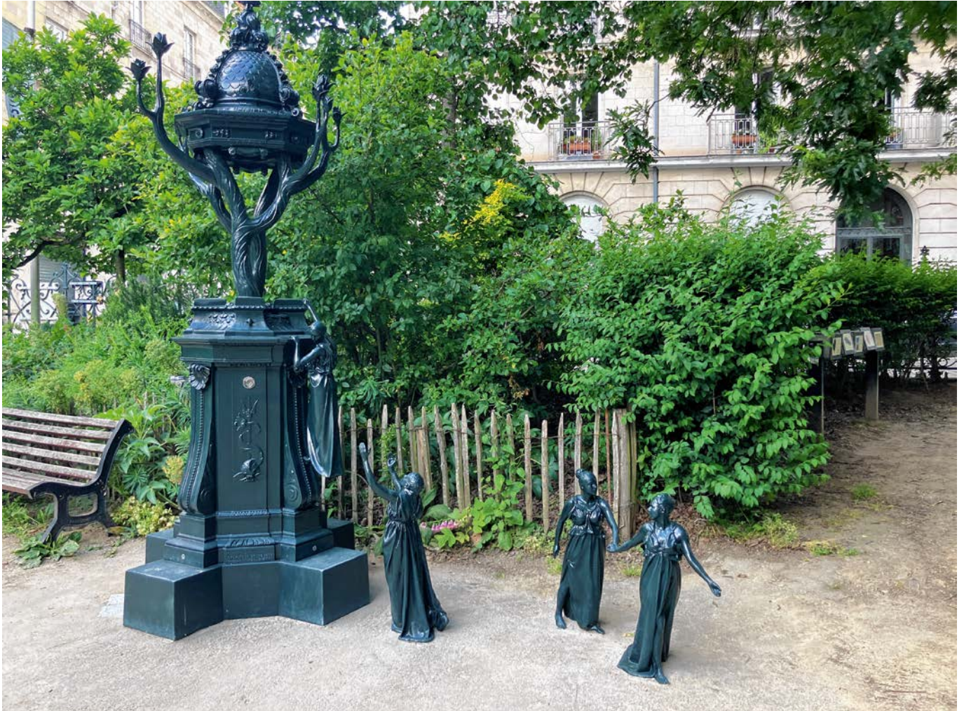
Nantes verbindet Umwelt und Kultur