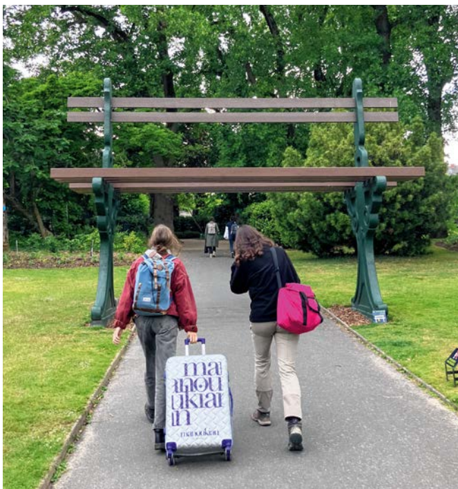
Riesensache: Der Jardin des Plantes verändert die Perspektive