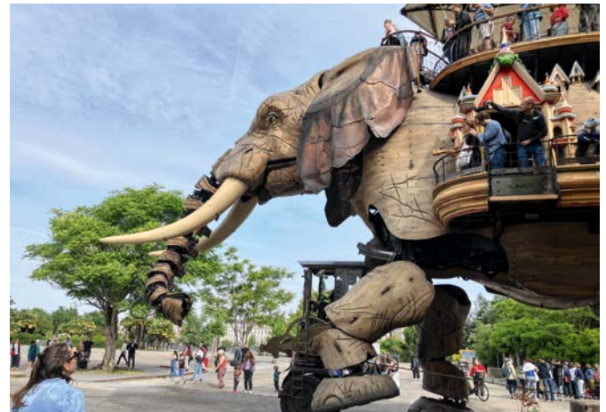
Mit besten Grüßen von Jules Verne: Les Machines de l'Île

Riesengroß müsste man sein, wollte man auf dieser Art Stühle im über sieben Hektar großen Jardin des Plantes Platz nehmen. Und wir wollen ja auch erstmal weiter, wollen die ehemalige Hafenstadt entdecken. Fun Fact für unterwegs: In Nantes liegt das geographi-